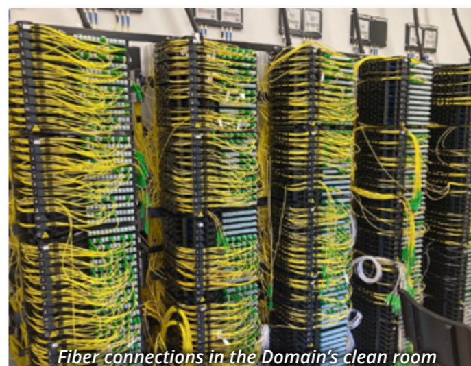
Fiber connections in the Domaine's clean room