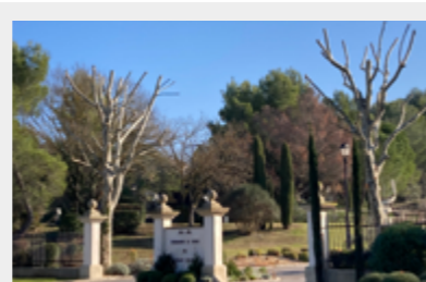
Pruning of the plane trees at the entrance of the Domain, and decoration of the surroundings (jars and local plants).