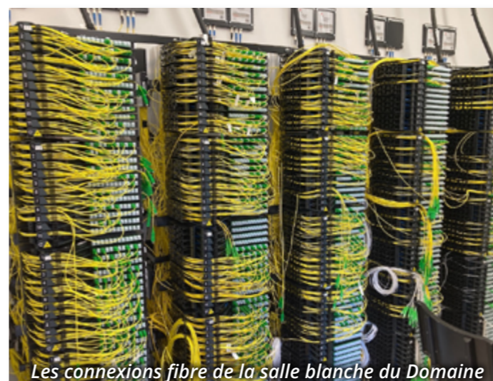
Les connexions fibre de la salle blanche du Domaine