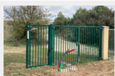
Installation of the pedestrian gate for the "joggers" access (near the golf practice). Commissioning in Spring 2023.

Works undertaken during the 4th quarter 2022