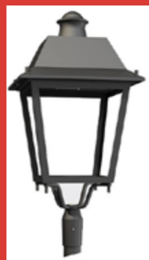
Modèle LED Venezia retenu

permettront également, grâce à la garantie de la lanterne (10 ans), d'économiser sur le contrat d'entretien (changement des ampoules).