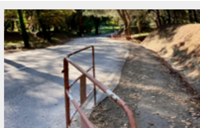
Trenches for the installation of video protection cameras (electricity & fiber).